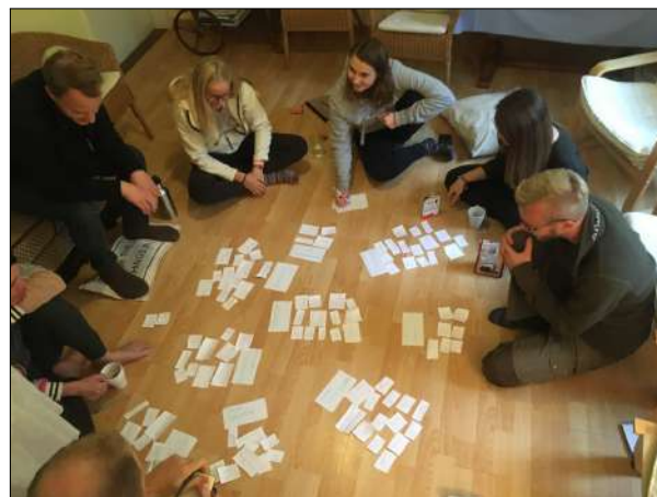
Viele Ideen wurden gesammelt.