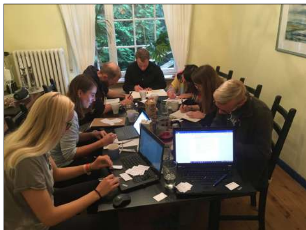
Treffen der Taskforce Watt°N-Spirit.

Im Frühjahr 2021 fanden online erste gemeinsame Brainstorm-Sitzungen statt, in denen