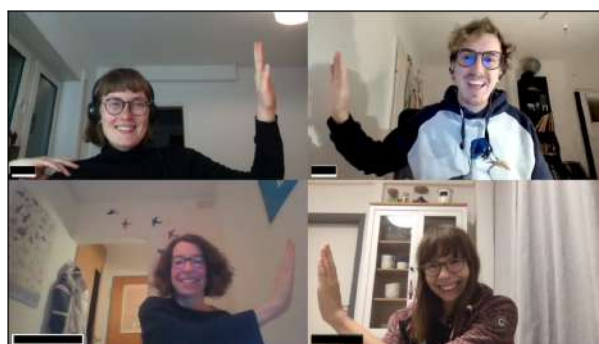
AG-ÖA: Auch bei den virtuellen Treffen herrschte gute Laune.

Derzeit arbeiten 15 Mitglieder des Netzwerkes Watt°N in der Arbeitsgruppe Öffentlichkeitsarbeit. Davon sind sieben Teamende hauptsächlich mit der Redaktionsarbeit des Netzwerkes beschäftigt. Die weiteren Mitglieder arbeiten unter anderem gestalterisch in der AG Design, konzeptionell im Fundraising, im Bereich Social Media oder der AG IT und Website. Dies ermöglicht eine gute Kommunikation und Zusammenarbeit mit den jeweiligen AGs und