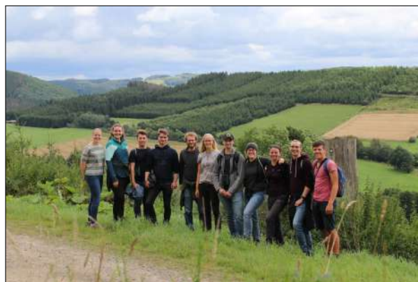
Wandern beim Teambuilding im Sauerland.

Im Jahr 2021 wurden ausschließlich virtuelle Teamtreffen geplant. Die Internettelefonate ermöglichten es, den Teammitgliedern, sich untereinander auszutauschen und einen Überblick über die Gegebenheiten der verschiedenen AGs zu verschaffen. Im Vorfeld eines jeden großen Treffens konnten sich die AGs untereinander austauschen, um dann die gesammelten Punkte beim gemeinsamen großen Treffen vortragen zu können. Auch in diesem Jahr wurde durch